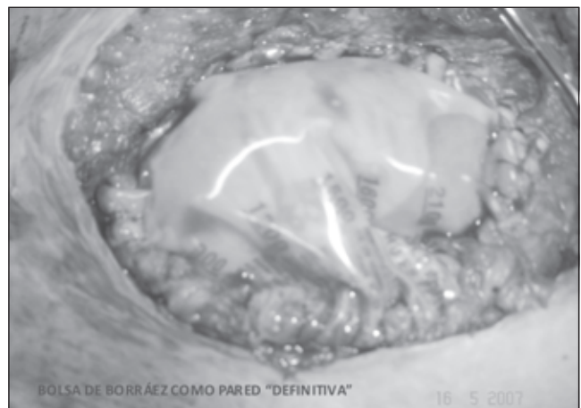
FIGURA 3. Colocación de Bolsa de Borráez, fijada a la aponeurosis, haciendo parte en forma definitiva de la pared abdominal.

Debo mencionar que cuando intervengo pacientes a quienes se les va a corregir defectos en la pared abdominal (por ejemplo eventraciones) y durante la liberación de adherencias se producen lesiones intestinales, muchas de ellas inevitables, recomiendo no utilizar elementos protésicos tipo mallas sintéticas, porque meses después se empiezan a presentar reacciones tipo granulomas a cuerpo extraño, posiblemente por la contaminación presentada en la cirugía previa. Recomiendo la utilización algunas veces de segmentos de la bolsa de Borráez (plástica) fijada directamente a la aponeurosis en forma definitiva y de esta forma reemplaza a la fascia: actualmente tengo 54 pacientes que deambulan con este elemento plástico haciendo parte de su aponeurosis, en forma indefinida y sin reacción tisular alguna (14) (figura 3).