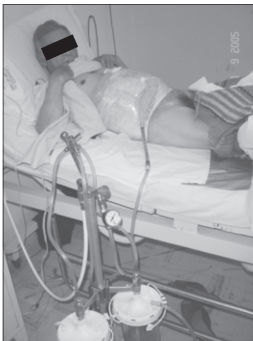
FIGURA 4: Sistema de presión negativa (tipo “Colombia”), utilizado por el autor; con el estropajo ( Luffa Cylíndrica ), que es una esponja vegetal.

“rechazo”, formación de fístulas por involucrarse dentro de las vísceras, formación de nuevas eventraciones porque se suelta de la fascia, etc... (1) . Para corregir estos grandes defectos recorro a la técnica del neumoperitoneo, descrita hacia el año 1940 el gran cirujano argentino Iván Goñi Moreno (39) . Introduzco aire dentro de la cavidad abdominal en forma gradual y progresiva y según la tolerancia por parte del paciente: de esta manera se intenta aumentar la capacidad de la cavidad y, algo muy importante, facilitar el procedimiento quirúrgico porque el aire ayuda a disecar las adherencias que existen. Luego durante la intervención quirúrgica tallamos las aponeurosis y realizamos múltiples incisiones, para de esta manera cerrar en forma definitiva la fascia (1, 3, 14) .