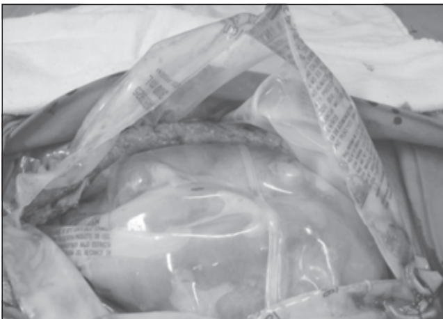
FIGURA 1. Utilización de doble bolsa plástica en la técnica del Abdomen Abierto.

peritoneal, suelta y cubriendo las vísceras abdominales. Luego si se coloca y fijándola a la piel la otra bolsa plástica. Esta modificación la he venido utilizando y recomendando desde el año 1995, y lo he hecho en los últimos 554 casos de aproximadamente 1.254 manejados con esta técnica (14) (figura 1). Esta variación facilita los abordajes sucesivos dentro de la cavidad abdominal, porque evita que se formen adherencias de las vísceras al peritoneo parietal disminuyendo ostensiblemente el riesgo de lesiones viscerales y facilitando los lavados de la cavidad y lo que es más importante, facilita el cierre definitivo de la cavidad abdominal. Cuando se considera que el paciente no requiere más drenajes ni lavados se retiran las dos bolsas, se tallan los colgajos aponeuróticos, tan ampliamente como sea necesario, se realizan múltiples incisiones en las fascias y de esta forma se aproximan los bordes sin tensión alguna y sin necesidad de utilizar mallas (1, 3, 14) (figura 2).