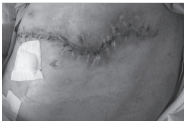
FIGURA 3. Aspecto de la herida después del tratamiento.