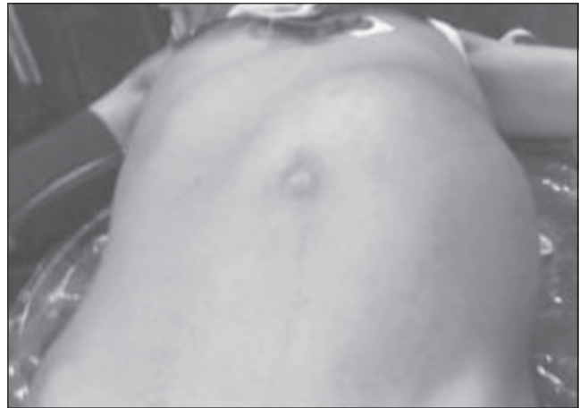
FIGURA 1. Vista del paciente donde se observa el tumor abdominal.

flanco izquierdo. Se expandió lentamente a todo el hemiabdomen y en los cuatro días previos a la operación ocurrió el cambio brusco de dolor e incremento de su tamaño (figura 1). El paciente notó, además, aumento de volumen del lado izquierdo del escroto, acompañado de dolor. Negaba la presencia de vómito, fiebre, sangre en la orina o defecación anormal.