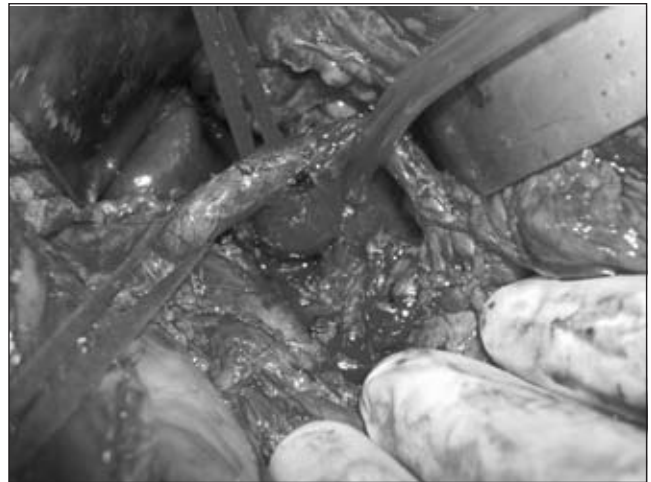
FIGURA 3. Abordaje del tronco celiaco por vía transperitoneal a través de la curva menor del estómago.

Se sometió a cirugía el 22 de septiembre, abordando la cavidad abdominal por laparotomía mediana supraumbilical e infraumbilical. El tronco celiaco se abordó por vía transperitoneal a través de la curva menor del estómago, disecando el epiplón menor; se disecaron los pilares del diafragma para tener control de la aorta supracelíaca (figura 3), se rodeó la aorta y se colocó un cadarzo con un hiladillo.