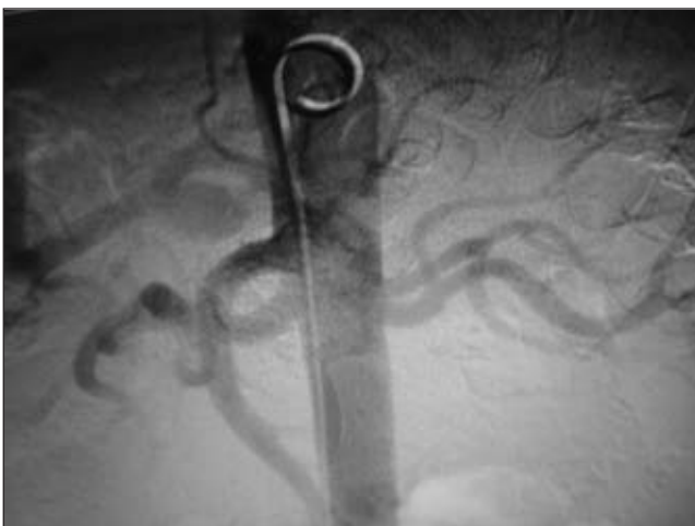
FIGURA 2. Arteriografía mesentérica en la que se corrobora la presencia del aneurisma.

El análisis que se hizo fue de un paciente de sexo masculino con dolor abdominal secundario al aneurisma del tronco celiaco, con agudización de sus síntomas, probablemente, dados por la aparición de la zona de disección, con riesgo de ruptura y embolia distal; se optó por una intervención quirúrgica abierta en vista de no haberse considerado el manejo endovascular.